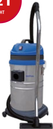
Réf. : 50000420 MAXXI 135 METAL