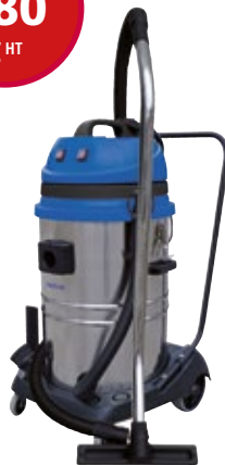
Réf. : 50000421 MAXXI 255 METAL