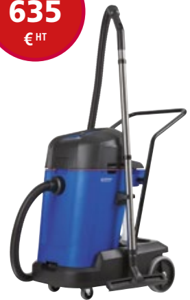
Réf. : 107405167 MAXXI 55-2 WD